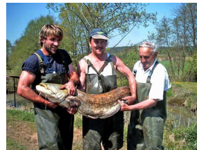
Wels aus dem Angelteich