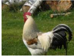
Der stolze Hahn