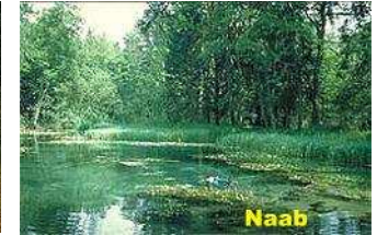
Naab bei Schwarzenfeld

Der Angelverein Schwarzenfeld lässt Gastangler in der Naab und Schwarzach angeln. Die Naab zeigt sich recht unterschiedlich. Die Breite variiert von 10 bis 60 Meter mit einer Tiefe von 1 bis 3 Meter. Tageskarten im Haus erhältlich (9 €).